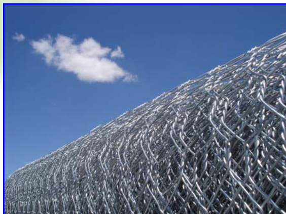
Foto 2 – Rete metallica in trafilato di ferro in maglia esagonale a doppia torsione utilizzata in campo faunistico