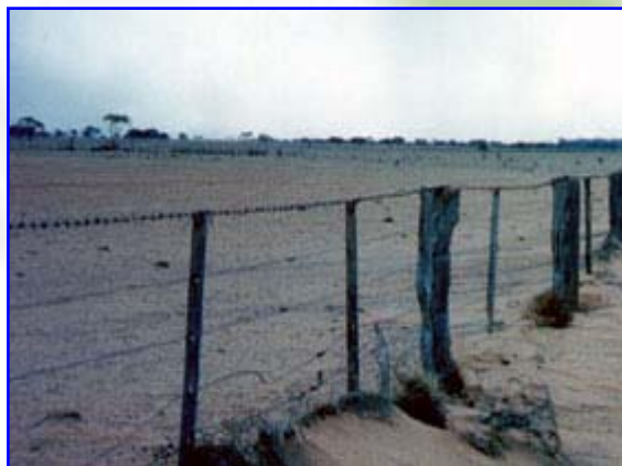
Foto 3 – Reti di protezione faunistica impiegate nel Parco Regionale di Migliarino di San Rossore – Massacciuccoli (PI)