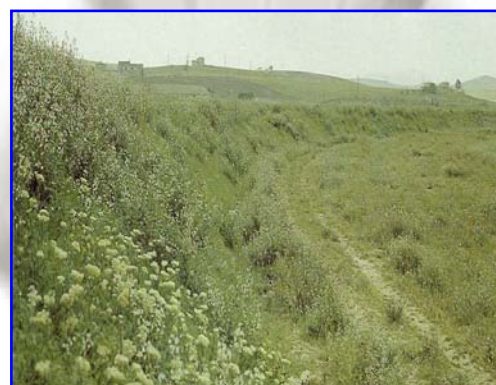
Foto 4 – Rivestimento di un argine golenale in materassi idraulici dopo il rinverdimento spontaneo