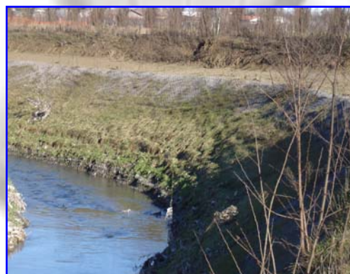
Foto 8 – La foto documenta la situazione dell'intervento a 10 mesi dalla fine dei lavori