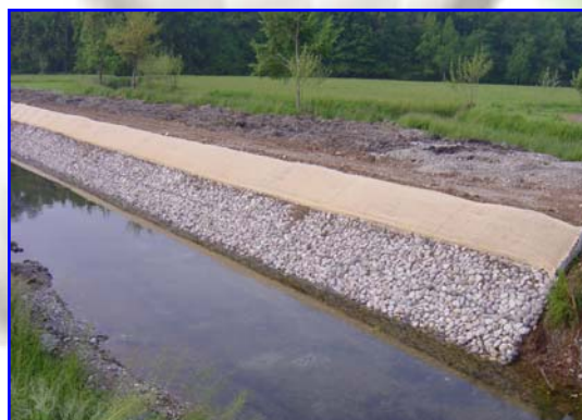
Foto 4 – Opera finita con coperchio di copertura in rete metallica a doppia torsione preassemblato con biorete in agave (in alternativa in cocco ignifugato)