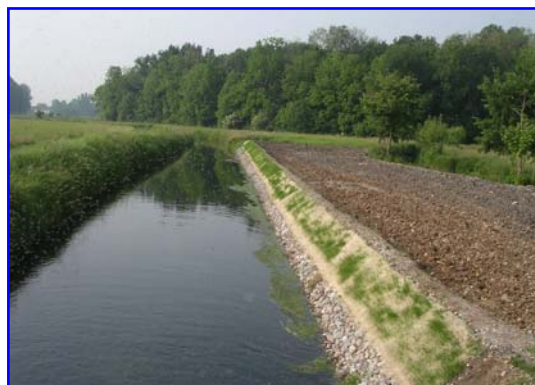
Foto 5 – Opera finita dopo un mese dal termine dei lavori, inizia la germinazione (n.b.: si è eseguita solo una leggera semina a spaglio)