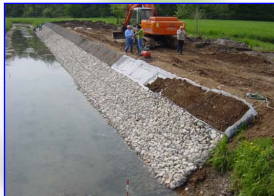
Foto 3 – Fasi di posa in opera, riempimento delle tasche con pietrame e con terreno vegetale