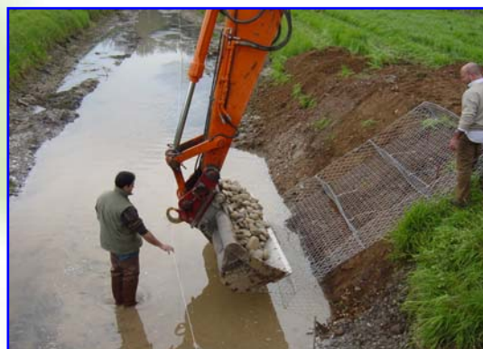
Foto 2 – Fasi di posa in opera, riempimento delle tasche "idrauliche" con ciottoli