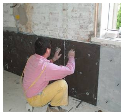
Posa delle piastre d'acciaio.