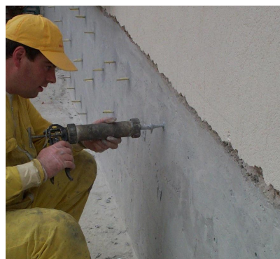
Foratura e posizionamento dei tiranti.