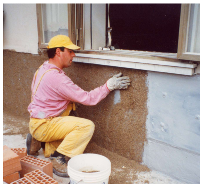
Spolvero di sabbia di quarzo come aggrappo per il successivo rivestimento.