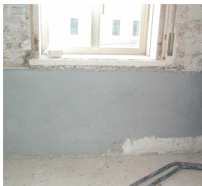
Situazione dopo la ricostruzione con resine.