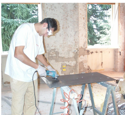
Preparazione delle piastre d'acciaio.