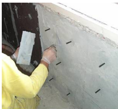
Stesura della resina Sikadur 31.