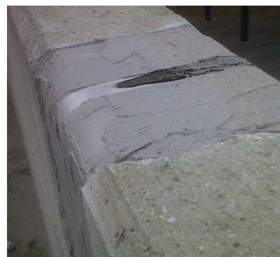
Posa in opera del sistema Combiflex.