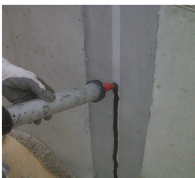
Sigillatura della parte centrale del Combiflex per garantirne l'elasticità nel tempo.