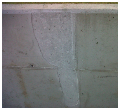
Rimozione del calcestruzzo ammalorato e preparazione della superficie.